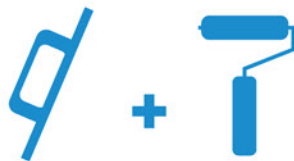
Llana + Rodillo