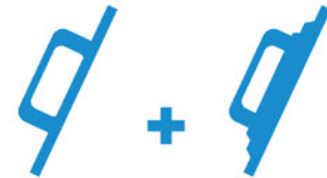
Llana + Platacho